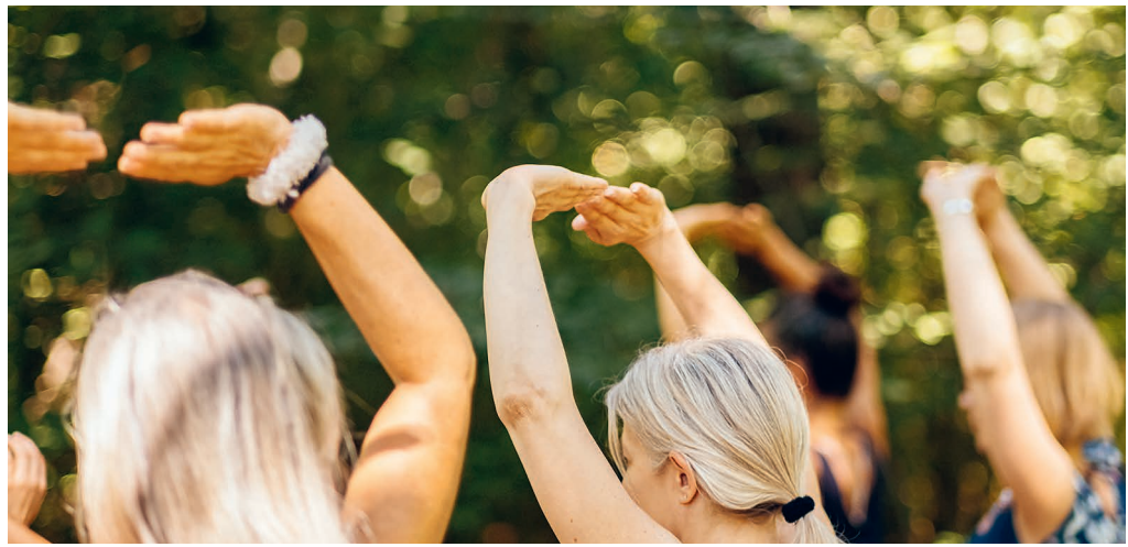
Die Unterweisungen sind sowohl aktiv als auch passiv.

«Der Geist hat keine Zeit, abzu- schweifen.»